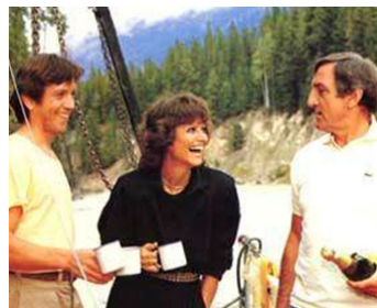
1982 LE RUFFIAN de José Giovanni avec Bernard Giraudeau, Lino Ventura