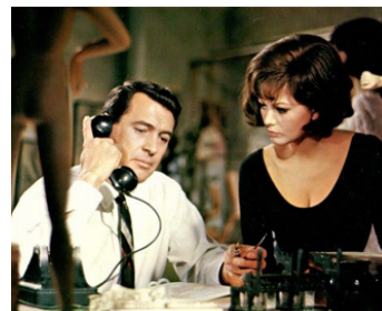
1965 LES YEUX BANDÉS (Blindfold) de Philip Dunne avec Rock Hudson