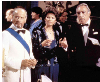
1980 LA SALAMANDRE (The Salamander) de Peter Zinner avec Eli Wallach, Anthony Quinn