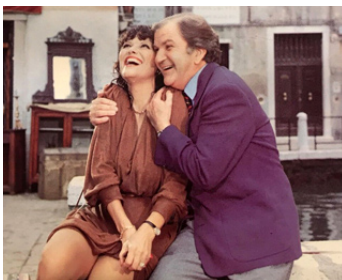
1981 LE CADEAU de Michel Lang avec Pierre Mondy