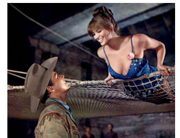
1964 LE PLUS GRAND CIRQUE DU MONDE (Circus World) d'H. Hathaway avec John Smith