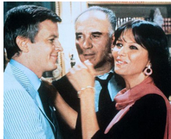
1977 LA PART DU FEU d'Étienne Périer avec Jacques Perrin, Michel Piccoli