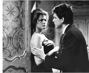
1960 LES DAUPHINS (I Delfini) de Francesco Maselli avec Tomas Milian