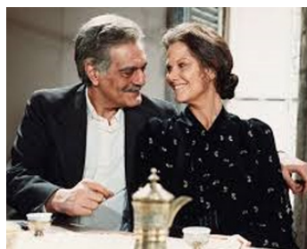
1991 MAYRIG/588 RUE PARADIS d'Henri Verneuil avec Omar Sharif