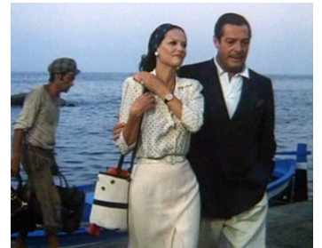
1980 LA PEAU (La Pelle) de Liliana Cavani avec Marcello Mastroianni